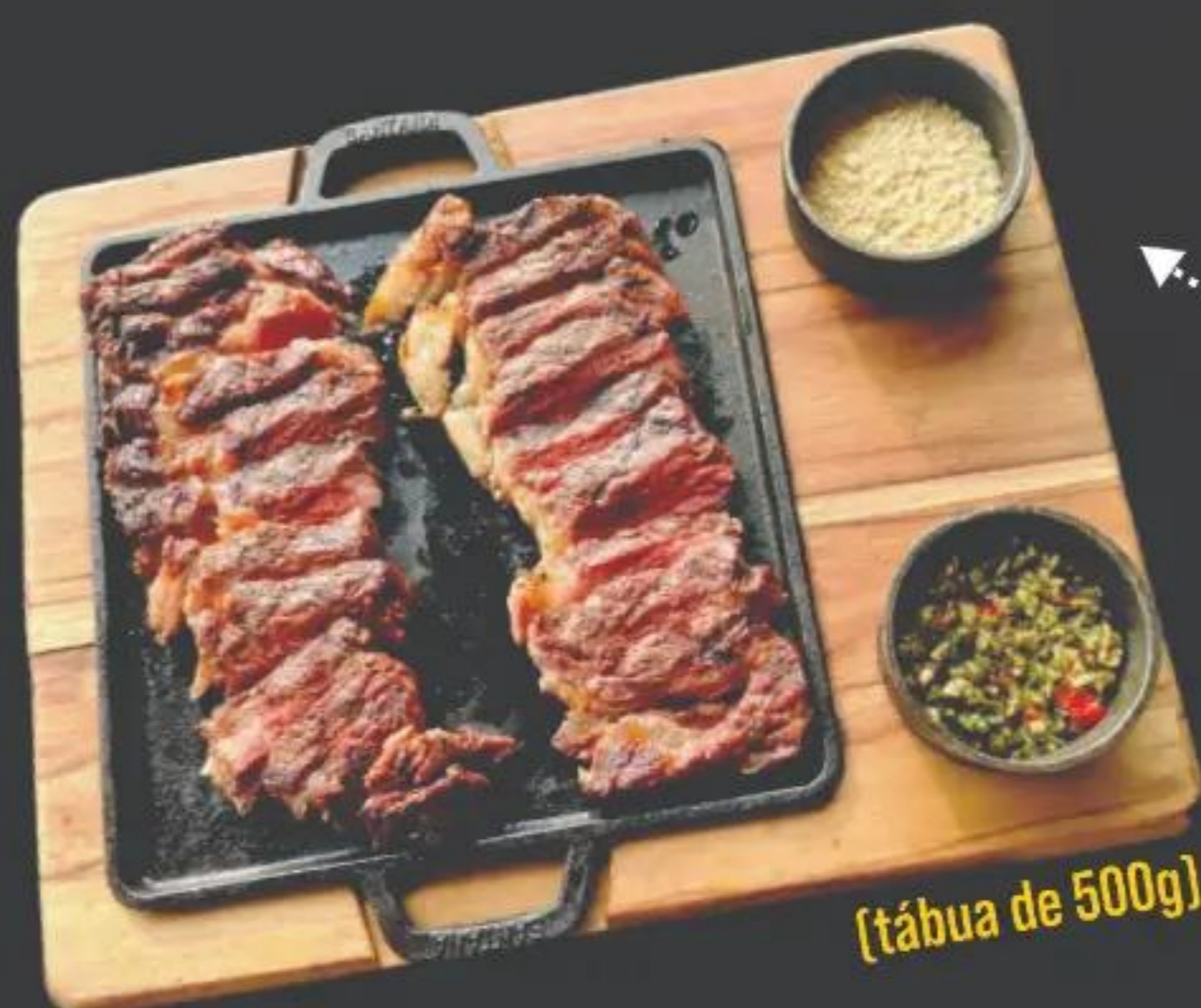
[tábua de 500g]