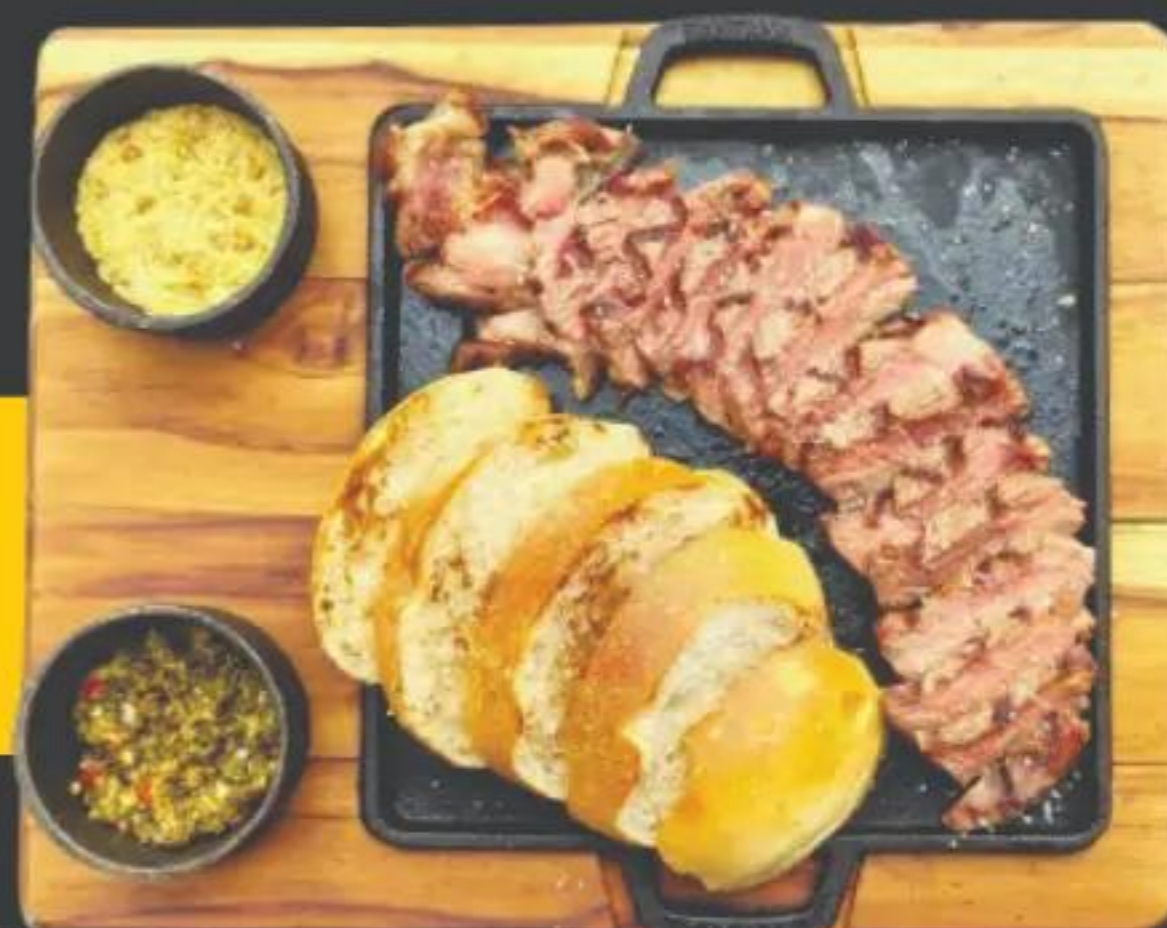
[tábua de 250g]

ESCOLHA SUA CARNE E O TAMANHO: (As tábuas acompanham pão, chimichurri e farofa)