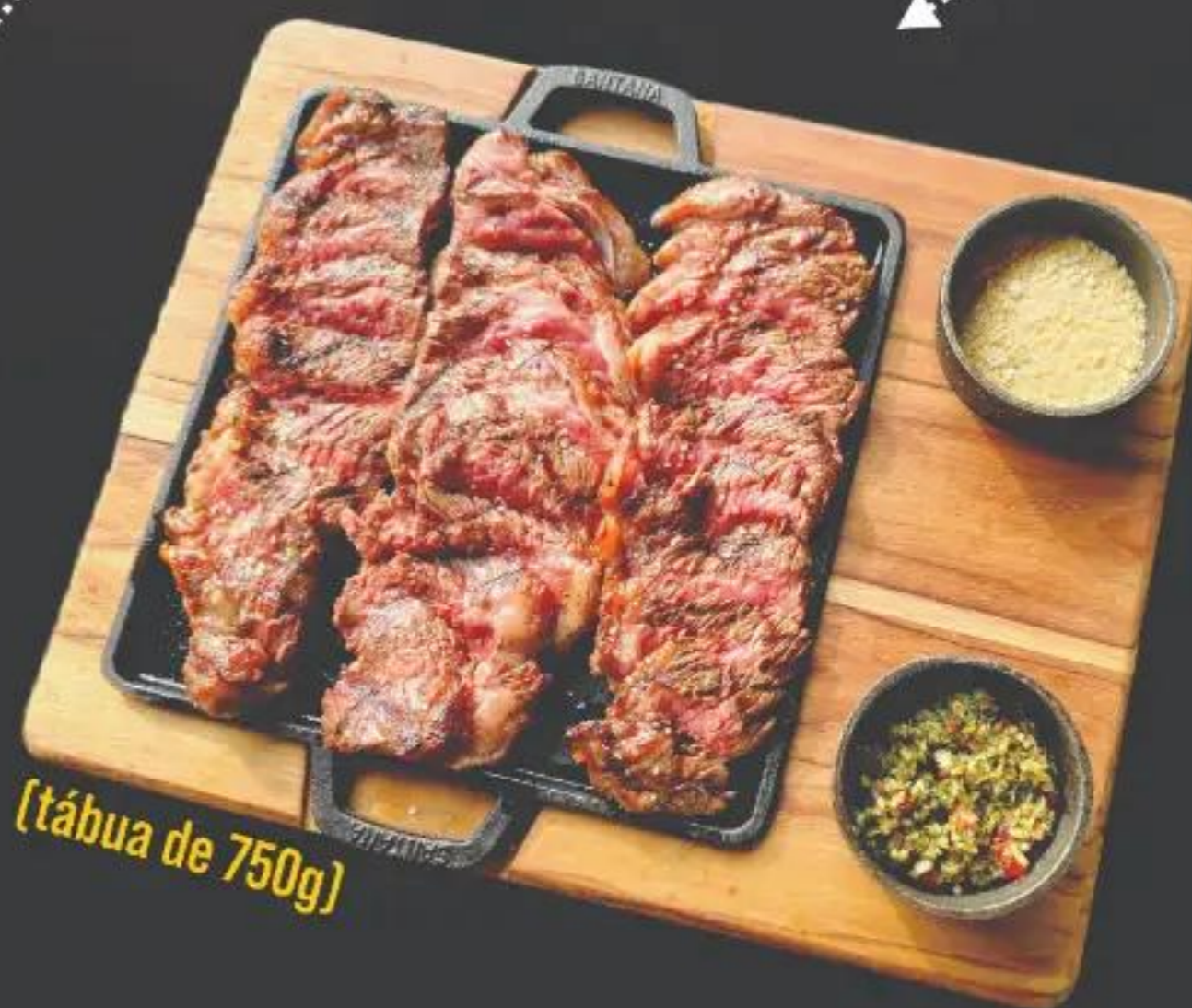
[tábua de 750g]